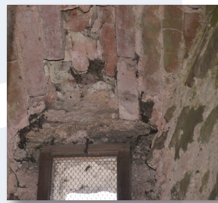
Stark geschädigtes Ziegelmauerwerk.