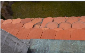
Fehlende / auf den Kirchenvorplatz abgestürzte Biberschwanzdachplatten.