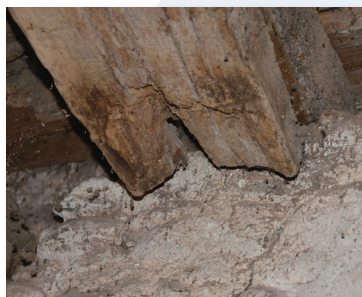
Fäulnisschäden in den Auflagerbereichen der Deckenbalken.

Der Außenputz weist teilweise Risse und Hohllagen auf, Anstriche sind abgewittert, insbesondere an Holzteilen wie den Schallläden.