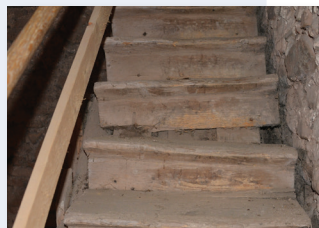
Schäden / Abnutzung Treppenaufgang, provisorisches Geländer.