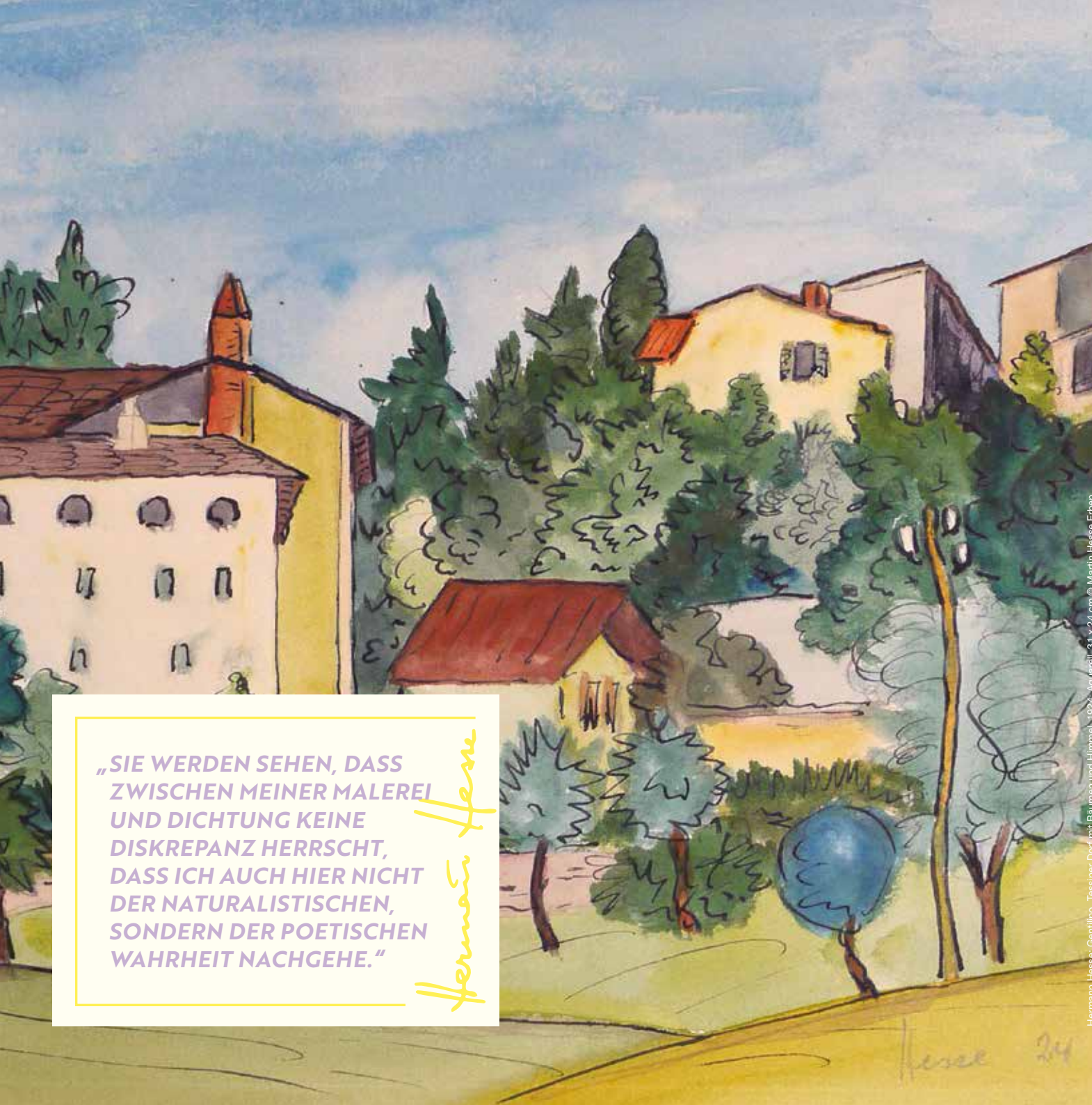
Hermann Hesse: Tessiner Dorf mit Bäumen und Himmel, 1924, Aquarell, 31 x 24 cm

„SIE WERDEN SEHEN, DASS ZWISCHEN MEINER MALEREI UND DICHTUNG KEINE DISKREPANZ HERRSCHT, DASS ICH AUCH HIER NICHT DER NATURALISTISCHEN, SONDERN DER POETISCHEN WAHRHEIT NACHGEHE.“