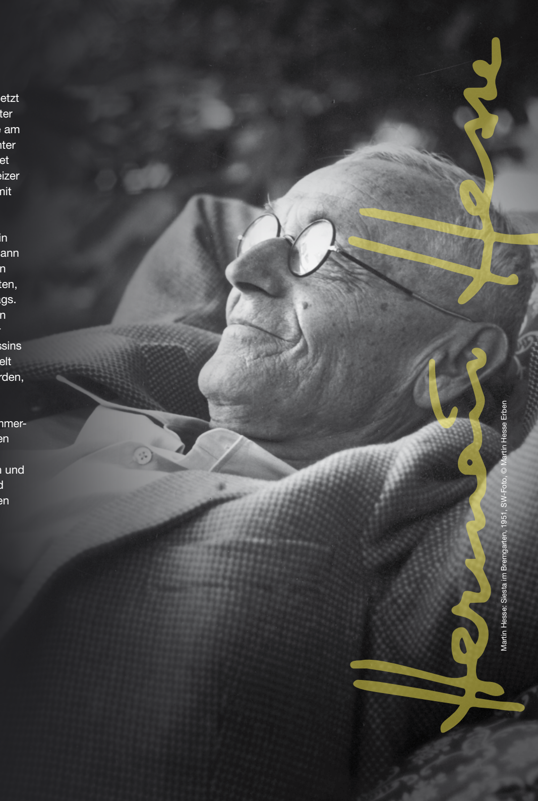
Martin Hesse: Siesta im Biergarten, 1951, SW-Foto, © Martin Hesse Erben

In ihrer Gesamtheit bietet die Große Sommerausstellung 2026 einen seltenen, dichten Blick auf Hermann Hesse: Sie vereint Malerei, Zeichnung, Märchenillustration und Fotografie zu einem vielschichtigen und faszinierenden Porträt einer einzigartigen Künstlerpersönlichkeit.