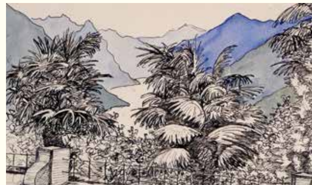
Hermann Hesse: Blick von Camuzs-Terrasse auf Tessiner Landschaft mit Bäumen, 1931, Tusche/Aquarell, 30 x 24 cm © Martin Hesse Erben