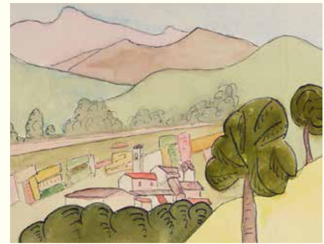
Hermann Hesse: Tessiner Dorf, Felder, Hügel, Berge, 1935, Aquarell, 16 x 12 cm

So zeigt die Ausstellung, beginnend ab 1916, die unterschiedlichen Schaffensphasen, Themen, Gattungen und Stilrichtungen, in denen Hesse seine ersten Schritte in der Malerei entfaltete: frühe Studien mit vielseitigen Bildinhalten, leuchtende Landschaftsaquarelle, detailreiche Federzeichnungen und ein kleinformatig illustriertes Manuskript.