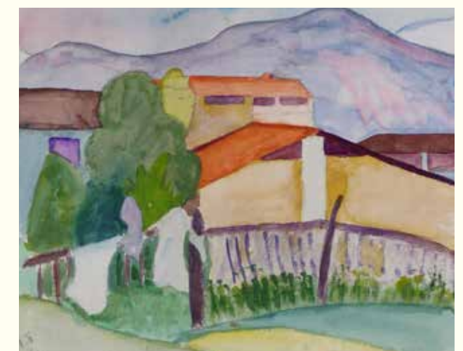
Hermann Hesse: Tessiner Häuser, Berge, 1921, Aquarell, 31 x 24 cm © Martin Hesse Erben