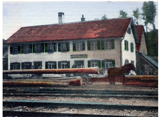
Gasthaus zur Eisenbahn