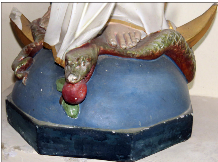
Links der Zustand der Marienfigur (Teilansicht) vor der Restaurierung durch Erwin Roth im Jahre 2024. Rechts restauriert.

Marien-Darstellung. Beide Füße Mariens stehen auf der Schlange.