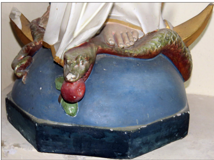
Links der Zustand der Marienfigur (Teilansicht) vor der Restaurierung durch Erwin Roth im Jahre 2024. Rechts restauriert.

Weiter ist unsere Muttergottes als Schlangenzertreterin dargestellt. Auch das ist – wie die Mondsicheldarstellung – ein häufiges Motiv in der Marien-Darstellung. Beide Füße Mariens stehen auf der Schlange.