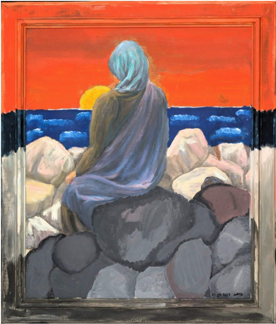
Silas Menig „The Sunset of Dreaming“