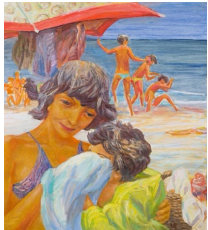
E. Manall „Mami trocknet ab“ 1986 70 x 80 cm

Auch die entspannte Arbeitsatmosphäre hat uns bei der Ideenfindung geholfen.