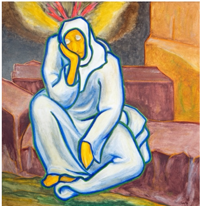
E. Manall Jeremia 1972 90 x 95 cm

Deshalb fragen wir: Was denkst und fühlst du?