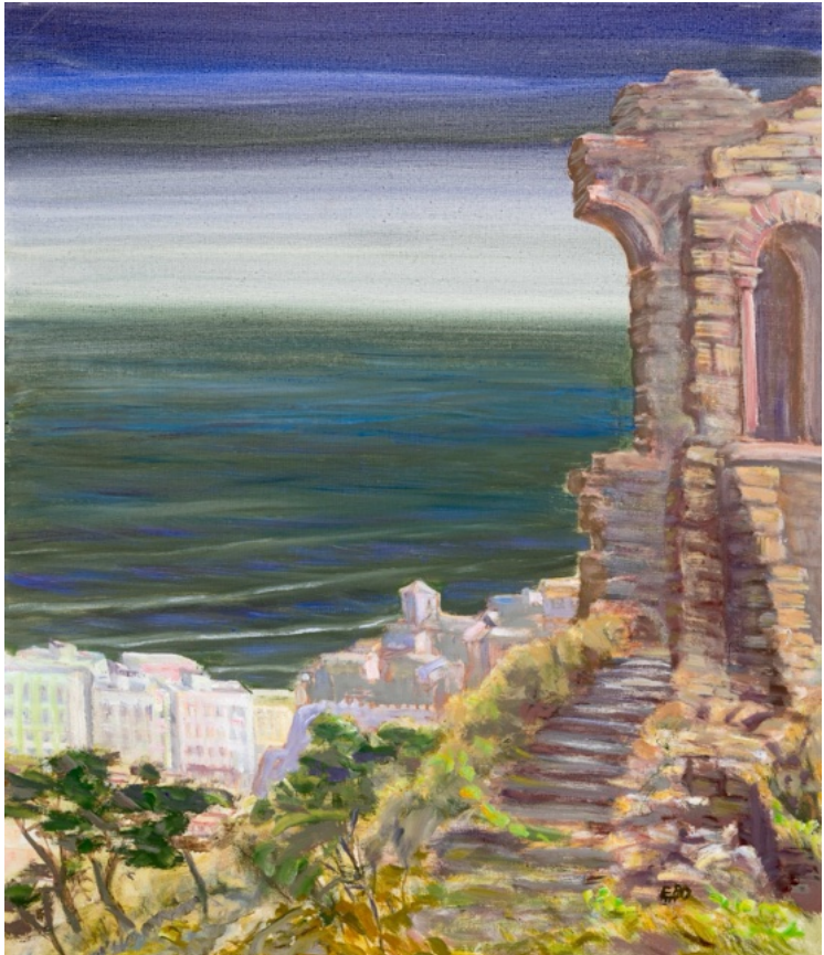
E. Manall Cupra marítima 1980 70 x 80 cm

Durch hellere Farben, mehr Licht und das intensive Blau des Meeres entstand eine freundlichere und lebendigere Atmosphäre. Das Bild lädt dazu ein, den Blick schweifen zu lassen, den Moment der Ruhe zu genieÙe und von fernen Orten zu träumen.