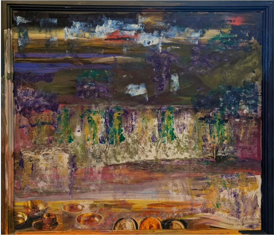
Uta Schubert „Es war einmal in einer weit entfernten Galaxie...“