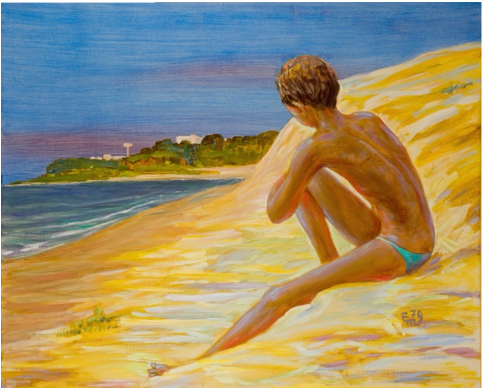
E. Manall Blick nach Albaretta 1979 80 x 65 cm

Die ursprüngliche menschliche Figur wurde bewusst aus dem Bild genommen, damit der Ort selbst mehr wirken kann. Durch den Leuchtturm, die Liegen und die Sonnenschirme steht nicht mehr eine einzelne Person im Mittelpunkt, sondern eher das Gefühl eines Sommertages. So entsteht ein Bild, das Raum für eigene Erinnerungen, Ruhe, Freiheit und vielleicht auch ein bisschen Sehnsucht lässt.