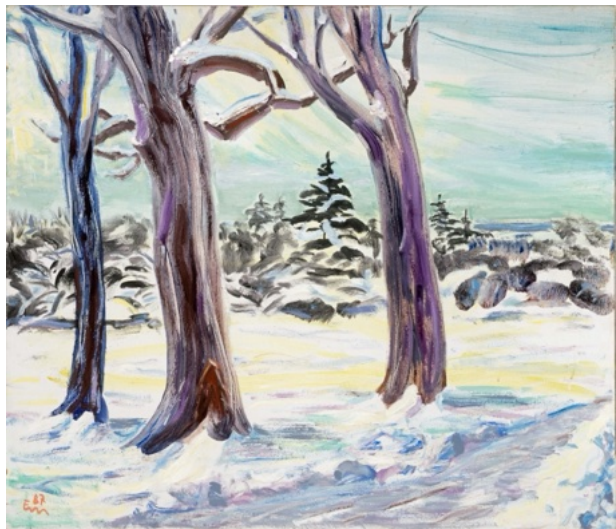
E. Manall Winter 1987 80 x 60 cm

Insgesamt hat uns der ganze Prozess sehr viel Spaß gemacht. Seine eigenen Ideen in ein eigentlich schon fertiges Bild mit einzubringen, war eine interessante und spannende Erfahrung.