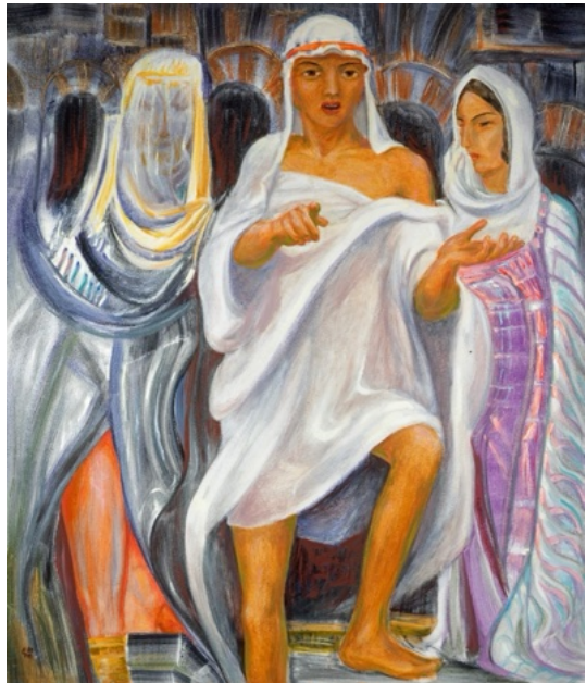
E. Manall Die großen Propheten - Daniel, 1981 102 x 120 cm