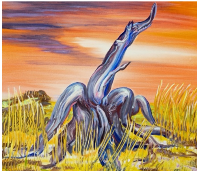
E. Manall Wurzel Paule (Gier) 1982 80 x 70 cm

Dennoch bleibt der chaotische Himmel als Kontrast, um den ewigen Kampf zwischen Gier und Hoffnung zu zeigen.