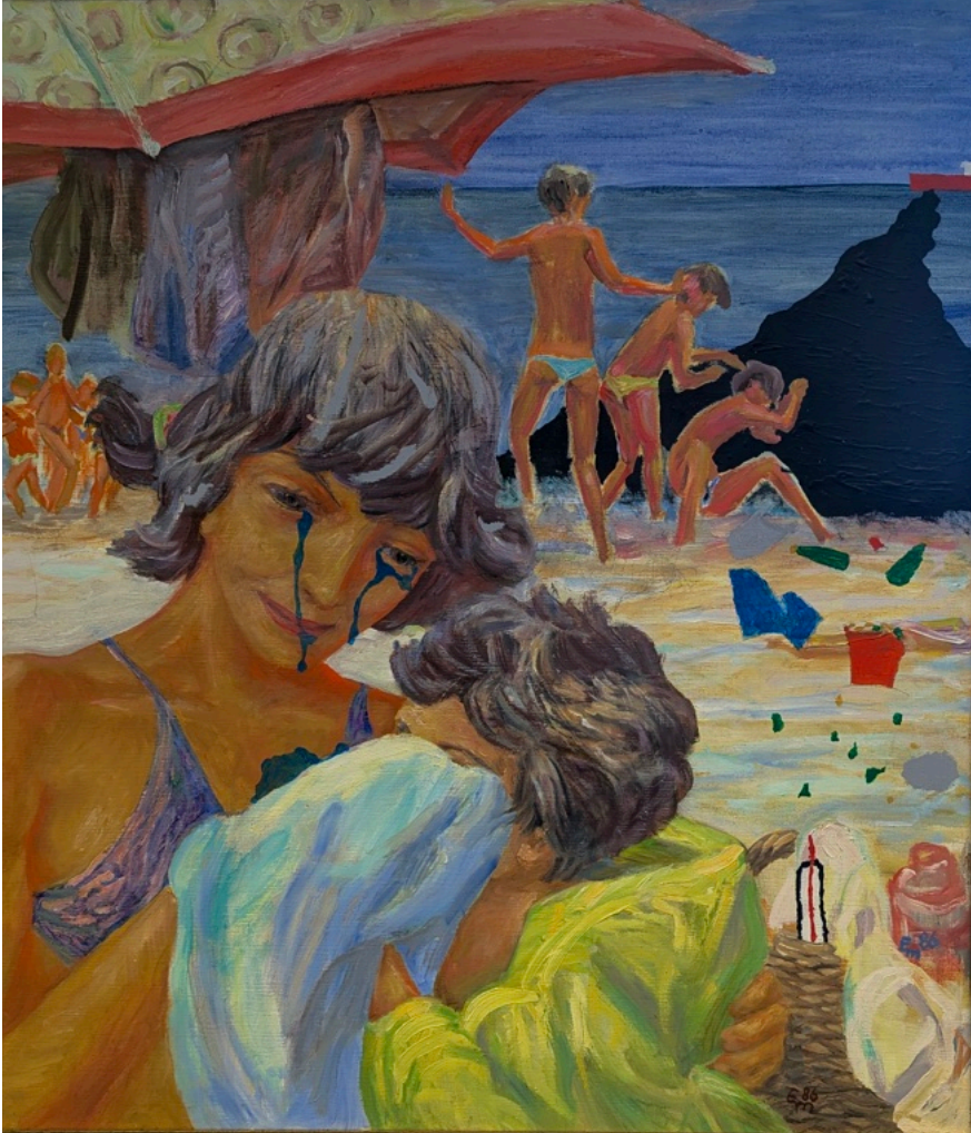
Anton Baumann und Felix Niedermann „Unbeschwert?“

Auf den ersten Blick wirkt das Gemälde wie eine entspannte Strandszene: Menschen genießen die Sonne, das Meer glättet sich und die Farben schmeicheln einem warmen Sommertag. Wer genauer hinschaut, entdeckt jedoch eine Kehrseite.