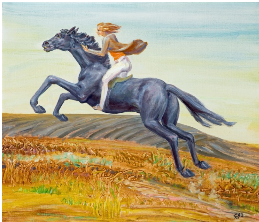
E. Manall Manuela auf der Flucht 1983 70 x 60 cm