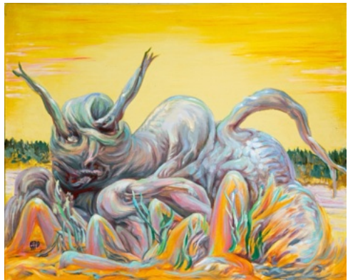
E. Manall Baumwurzel-Katze 1979 80 x 65 cm

Im Laufe der langen Zeit, wo sie da lag, veränderte sich die Landschaft. Gras wuchs über die karge Erde. Wasser sammelte sich zwischen den Steinen. Der Himmel bekam wieder Farbe. Berge und Täler bildeten sich. Und mit der Natur kam auch das Leben zurück. Das Wesen verschwand nicht völlig. Es verwandelte sich. Aus der verzerrten Wurzel wurde ein Löwe, wachsam, stolz und ruhig. Im Hintergrund stehen Giraffen und beobachten still diese Veränderung. Sie erinnern daran, dass selbst in einer rauen Welt wie der unseren, Frieden zwischen verschiedenen Kulturen möglich sein kann, wenn man sich nicht länger bekämpft. Manchmal kann aus etwas sehr kargen fruchtbares entstehen.