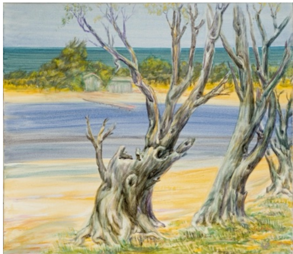
E. Manall, Bäume bei Porto Caleri, 1978 90 x 80 cm

Insgesamt wollten wir durch den Einsatz gesättigter Farben zeigen, wie sehr die farbliche Gestaltung die emotionale Wahrnehmung eines Ortes beeinflussen kann.