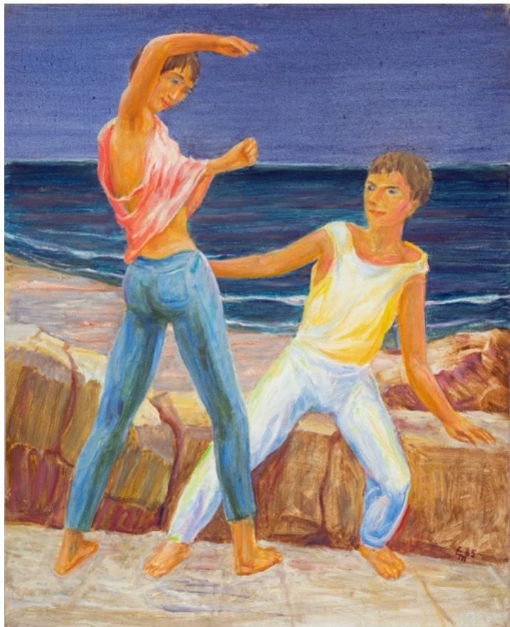
E. Manall Junges Paar am Strand 1985 65 x 80 cm

Es geht immer weiter Alkohol und Zigaretten, Drogen und Schnaps kommen dazu und aus friedlichen Kindern werden abhängige Jugendliche.