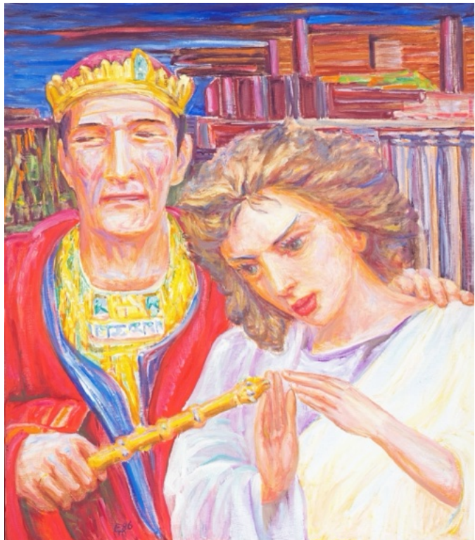
E. Manall Königin Esther 1986 70 x 80 cm

Den Hintergrund habe ich mit Blau übermalt, um Ablenkungen zu vermeiden und den Fokus stärker auf die Figur zu lenken.