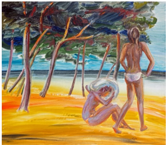
E. Manall In der Pineta von Scacchi 1990 80 x 70 cm

Steht sie wirklich dort am Strand? Oder geht sie ihrer Sehnsucht nach?