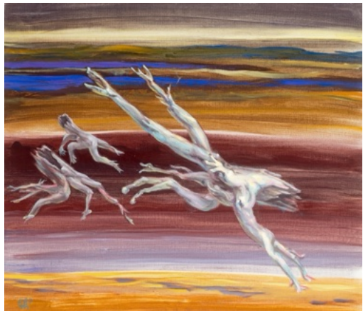
E. Manall Flucht in die Zukunft 1980 66 x 58

So entstand aus etwas sehr bildlichen etwas komplett abstraktes. Dieser Prozess zog sich über mehrere Wochen.