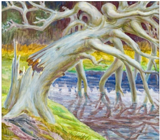
E. Manall Gebrochener Baum 1987

Den Titel „Das Leben vieler“ haben wir gewählt, da sich Monotonie und Eintönigkeit oft in das Leben vieler von uns einschleichen. Die selben Arbeitswege, Leute, Hobbys – in der heutigen Zeit wird es durch Technik und Social Media immer leichter, das Leben anderer ständig zu verfolgen, während wir oft gar nicht merken, wie unser eigenes Leben an uns vorbeizieht. Lebt ein wenig, sucht euch ein Hobby, das ihr nur zum Spaß machen könnt, und fangt an, euer eigenes Leben in die Hand zu nehmen!