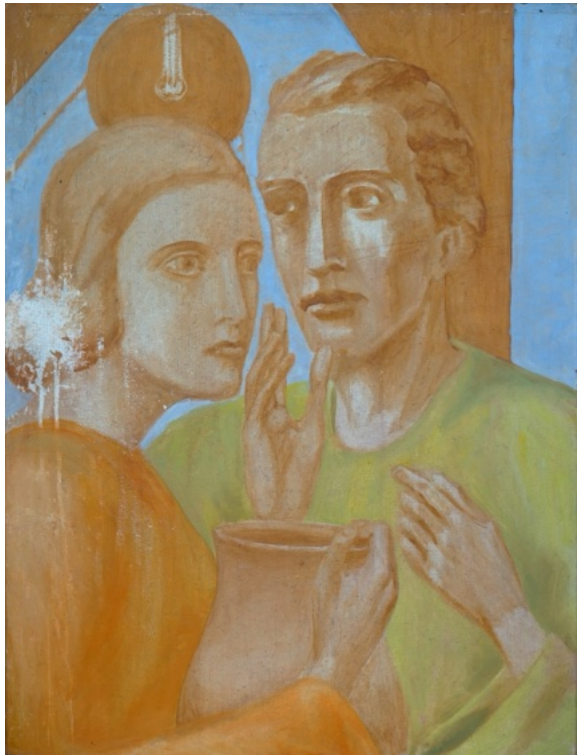
E. Manall Am Jakobsbrunnen I 1935 60 x 80 cm

Der Riss trennt die beiden, aber die Rose verbindet sie noch ein letztes Mal.