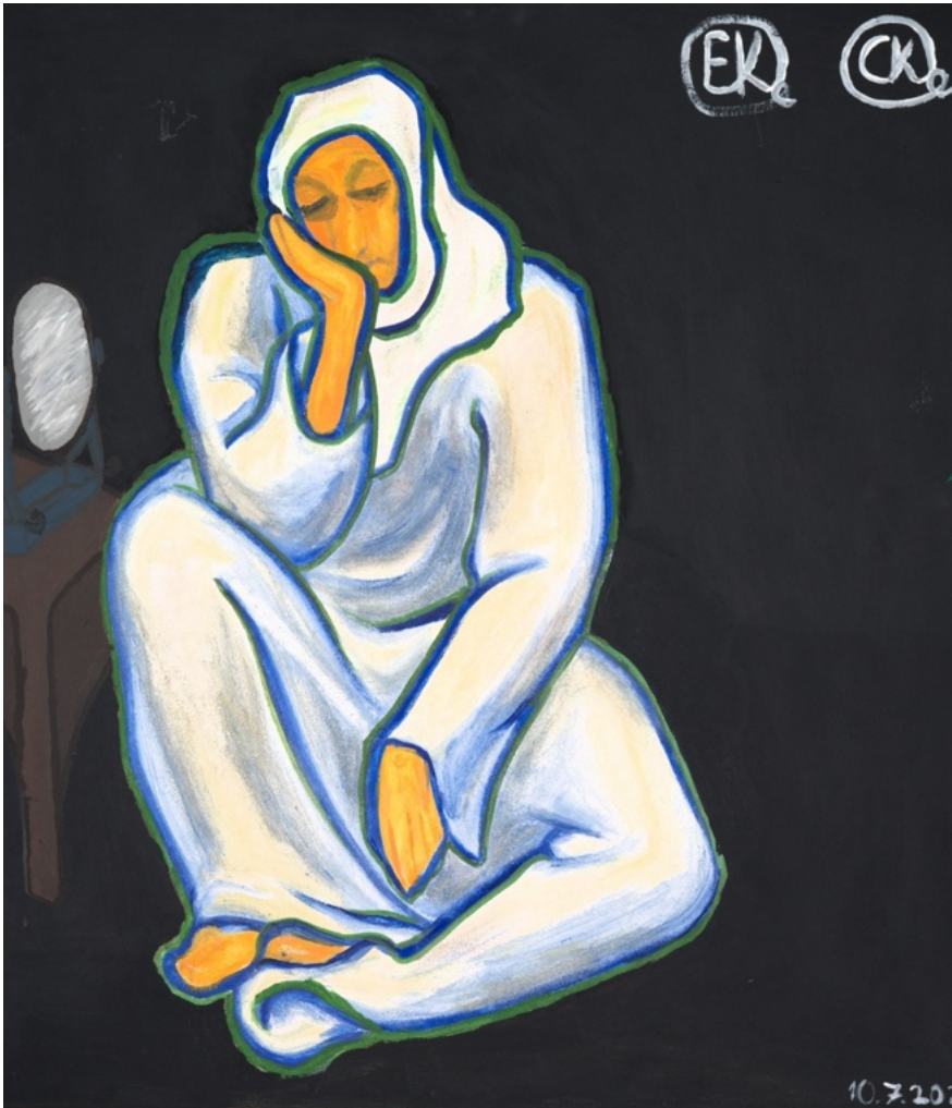
Elias Kling und Carl Kienle „Joch des Lochs“