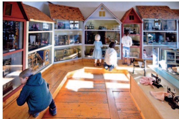
Faszinierend: Puppenstuben zeigen Interieur verschiedener Jahrhunderte

Weberei- und Trachtenstube darf in der ehemaligen Weberstadt Leutkirch natürlich nicht fehlen. Volkskunst, bürgerliches Leben und die hohe Kunst sind die Themen im zweiten Obergeschoss. Im Weißen Saal werden Gemälde und Skulpturen aus verschiedenen Epochen präsentiert. Neben Werken aus dem Umkreis der Bildhauerfamilie Zürn sind Arbeiten des Rokoko-Bildhauers Konrad Hegenauer zahlreich vertreten. Ein Sammlungsschwerpunkt sind die Zeugnisse religiöser Volkskunst mit dem Sonderthema der „Arma-Christi“. Dabei handelt es sich um die bildliche Darstellung der Passion Jesu in allerlei Formen, sei es als Fastenkrippe,