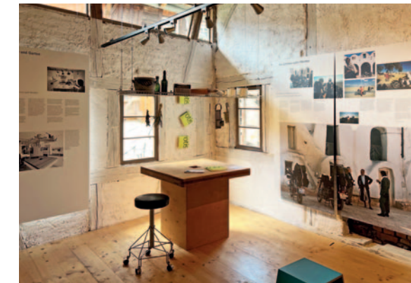
rotis und otl aicher: Einblick in Leben und Arbeit des Gestalters

Mittwoch 14–17 Uhr Erster Samstag im Monat 13–17 Uhr Sonn- und Feiertag 13–17 Uhr www.heimatpflege-leutkirch.de/museum