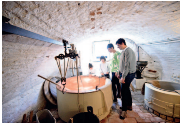
Käse und Allgäu: die historische „Käsküche“ im Gewölbekeller

Weberei- und Trachtenstube darf in der ehemaligen Weberstadt Leutkirch natürlich nicht fehlen. Volkskunst, bürgerliches Leben und die hohe Kunst sind die Themen im zweiten Obergeschoss. Im Weißen Saal werden Gemälde und Skulpturen aus verschiedenen Epochen präsentiert. Neben Werken aus dem Umkreis der Bildhauerfamilie Zürn sind Arbeiten des Rokoko-Bildhauers Konrad Hegenauer zahlreich vertreten. Ein Sammlungsschwerpunkt sind die Zeugnisse religiöser Volkskunst mit dem Sonderthema der „Arma-Christi“. Dabei handelt es sich um die bildliche Darstellung der Passion Jesu in allerlei Formen, sei es als Fastenkrippe,