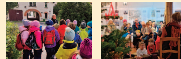
Zusammenkommen: Über den Jahresverlauf ist einiges los...

Im jährlichen Veranstaltungskalender finden sich zahlreiche Fixpunkte, wie beispielsweise das Adventssingen im Museumshof, der Handwerkermarkt im Frühjahr oder das Glasmacherfest im Herbst in Schmidfelden. Aktuelle Informationen und Termine finden Sie auf der Internetseite: www.heimatpflege-leutkirch.de