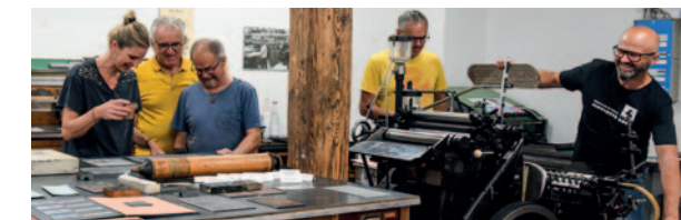
Alles funktionsbereit: Bleiletter, Klischees und ein Heidelberger Tiegel

Die Druckwerkstatt ist sonn- und feiertags sowie am ersten Samstag im Monat zu den Öffnungszeiten des Museums im Bock mit Setzern und Druckern besetzt. Wir freuen uns auf Ihren Besuch! Museum im Bock, Gänsbühl 9, 88299 Leutkirch im Allgäu