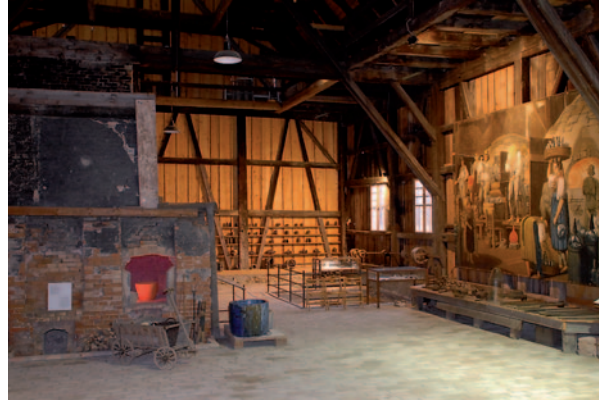
Imposant: Temper- und Abkühlöfen aus dem 19. Jahrhundert

Im Dachgeschoss des Glasmagazins scheint die Zeit stehen geblieben: Unzählige Gläser lagern hier noch in den Regalen. Ladenhüter! In erster Linie wurden einfache Gebrauchsgläser geblasen wie Flaschen, Trinkgläser, winzige Medizinfläschchen ebenso wie riesige Ballons für Säfte und Alkohol. Nur gelegentlich erzeugte man auch kost-