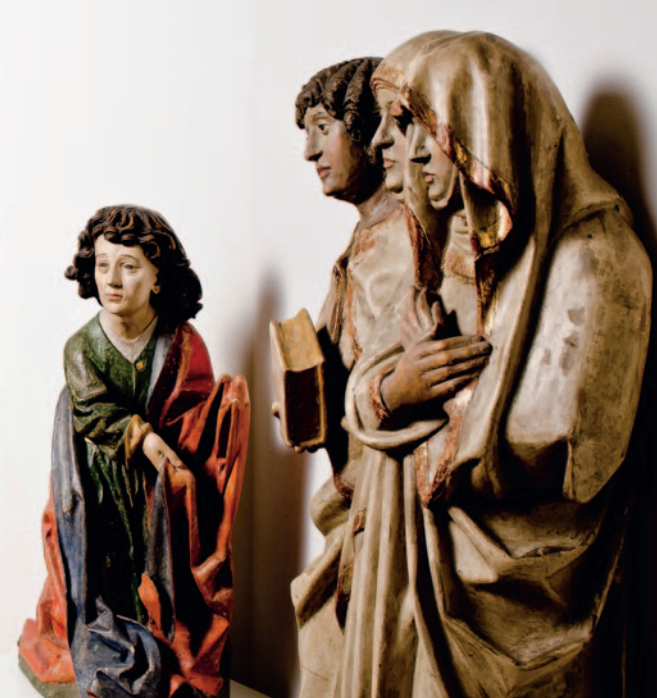
Wertvoll: Spätgotische Figurengruppe im Weißen Saal