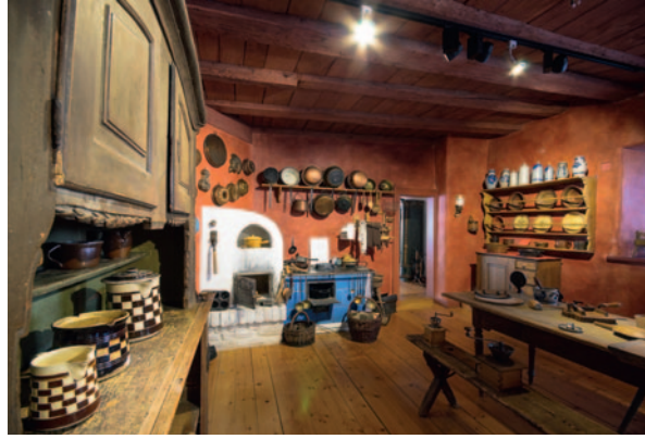
Zeitreise: In der „rote Küche“ ist liebevoll das Bauernleben widergespiegelt