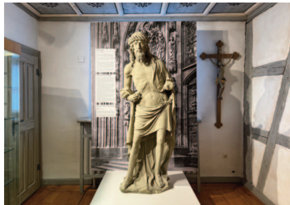
Hans Multscher: Der Schmerzensmann vom Portal des Ulmer Münsters

Hausaltärchen oder Gebrauchsgegenstände des täglichen Lebens wie Buttermodel mit den Symbolen der Passion. Breiten Raum nimmt auch das Thema Glas ein: Ergänzend zum Glasmuseum in Schmidsfelden werden kostbare Gläser gezeigt, ebenso ein Originalmodell des Glasmacherdorfes und allerlei Gerätschaften der Glasmacherei.