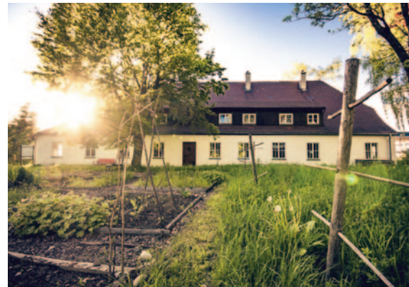
Gerettet: Im Jahr 2018 wurde die Sanierung des Leprosenhauses beendet