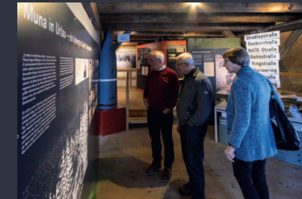
Sperrbezirk: Ein Blick über den Sperrzaun in die Geschichte der Muna

Was war vor der Ansiedlung von Center-Parcs Allgäu im Urlauer Tann? Verschiedene geheime militärische Anlagen von Wehrmacht, Bundeswehr und amerikanischen Einheiten hinterließen ihre Spuren. Die Geschichte von Aufbau 1939, Abriss, Wiederaufbau bis hin zur Außerdienststellung im Jahr 2007 wird akkurat aufgearbeitet und mit vielen Exponaten anschaulich präsentiert. Über den Wehrgang erreichbar, ist dieser Schwerpunktausstellung im Nebengebäude ein eigener Trakt gewidmet. Der Zugang erfolgt über das Museum im Bock. Zur Ausstellung ist ein Buch über die Geschichte der Muna erhältlich.