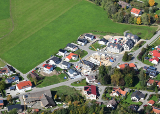
Viele Familien haben im neuen Wohngebiet in Friesenhofen ihre Heimat gefunden.