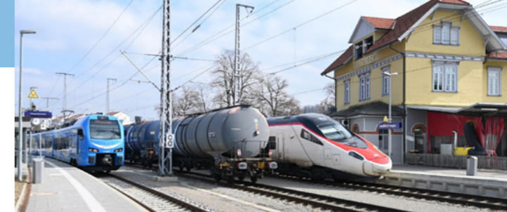
Unser großer Einsatz bei Bahnsteigmodernisierung und Elektrifizierung hat sich gelohnt.

Unsere bäuerlichen Familienbetriebe erzeugen nicht nur wertvolle Lebensmittel, sie pflegen auch unsere wunderschöne Allgäuer Naturlandschaft. Die Grünlandwirtschaft leistet einen wichtigen Beitrag zum Klimaschutz – unsere Landwirtschaft verdient unseren Respekt und unsere Unterstützung.