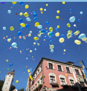
Farbenfrohe Luftballons beim Kinderfest.