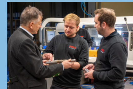
Regelmäßiger Austausch mit unseren Betrieben.