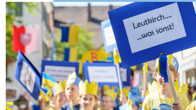
Leutkirch begeistert jede Generation.