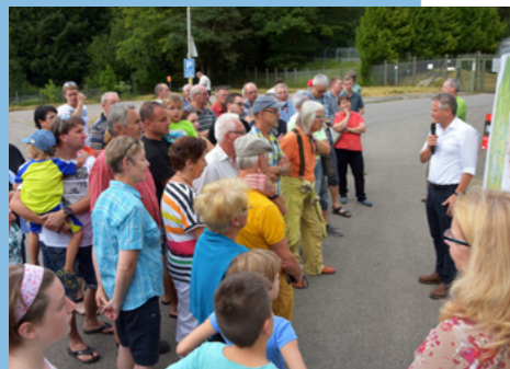
Mit den Menschen im konstruktiven Austausch (Ferienparksiedelung).

BÜRGERFREUNDLICHKEIT wird bei uns großgeschrieben. Sie haben mein Wort!