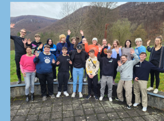
Unser aktiver Jugendgemeinderat.