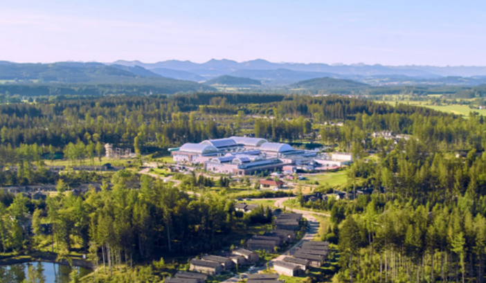
Center Parcs bringt viele Gäste und Kaufkraft in unsere Stadt.