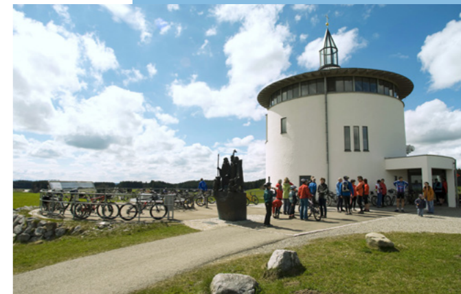
Die Galluskapelle ist ein ganz besonderer Ort der Ruhe und der Besinnung.