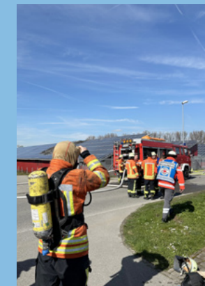
Auf unsere Rettungskräfte ist immer Verlass.