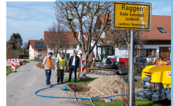
Wir investieren 60 Millionen € für schnelles Internet – die Arbeiten in Hof (Raggen) sind in vollem Gange.