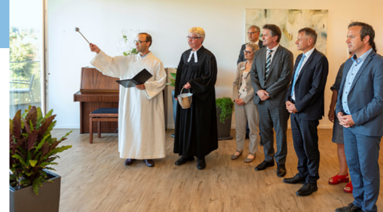
Ökumenische Segnung von unserem Hospiz Ursula.

Für dieses gute Miteinander setze ich mich weiterhin ein.