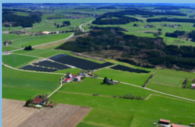
Wir sind bundesweit Vorreiter bei der Nutzung der Sonnenenergie.