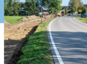
Hier entsteht der neue Radweg von Urlau nach Hinzang.