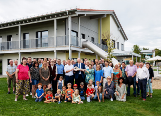
Schlüsselübergabe im neuen Kindergarten St. Martin in Wuchzenhofen.

Zielstrebig bereiten wir uns mit neuen Baumaßnahmen auf den Rechtsanspruch von Ganztagesbetreuungsangeboten an unseren Grundschulen vor.