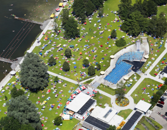
Unser Freibad „Stadtwäher“ ist ein Kleinod.

Durch die Ausweitung des professionellen Stadtmarketings, neuen zentrumsnahen Spiel- und Freizeitmöglichkeiten und kreativen Werbemaßnahmen erhöhen wir die Besucherfrequenz weiter und stützen Handel, Dienstleistung und Gastronomie.