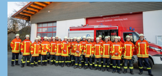
Neues Fahrzeug und neues Feuerwehrhaus in Hofs-Ausnang.

Unsere Feuerwehr steht an 365 Tagen im Jahr für unsere Sicherheit bereit. Alle Abteilungen sind inzwischen mit modernen Fahrzeugen ausgestattet. Nach der guten Unterbringung der Abteilung Hofs steht nun der Neubau des Feuerwehrhauses in Leutkirch auf unserer Agenda.