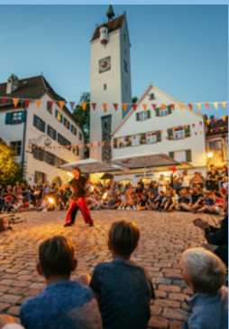
Bei uns ist immer etwas geboten.