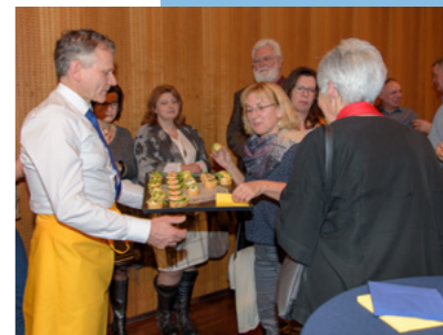
Anerkennung für engagierte Menschen.