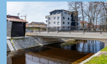
Neubau Mühlbachstraße und neue Brücke in Reichenhofen.