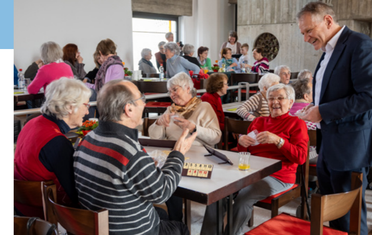
Frohes Miteinander bei „Herzswärme“ in der Dreifaltigkeitskirche.

Mit der Gründung einer gemeinnützigen Genossenschaft als Träger eines medizinischen Versorgungszentrums (MVZ) sichern wir die ärztliche Versorgung auch in Zukunft. Durch meine ehrenamtliche Mitarbeit im Aufsichtsrat der Allgäu-GmbH können wir dieses gute Netzwerk auch bei der Gewinnung ausländischer Pflegekräfte für unsere Einrichtungen nutzen.