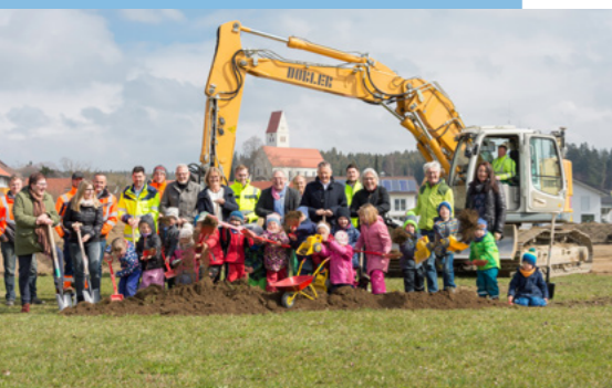
Startschuss für das Wohngebiet „Obstwiesen“ in Gebrazhofen.