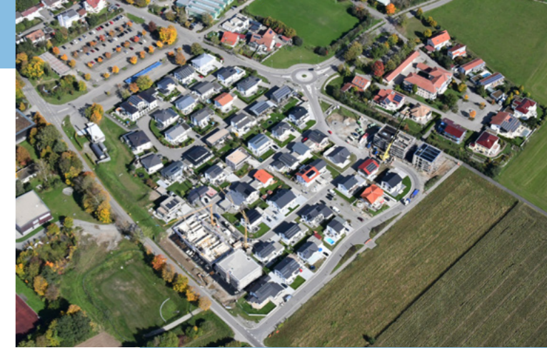
Wohngebiet Öschweg – Heimat für viele Familien.