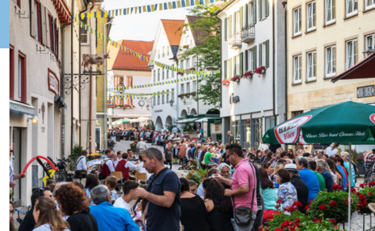
Leutkirch trifft sich – Vespertafel zum Auftakt des Altstadt-Sommer-Festivals (ALSO).