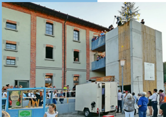
Die Genussmanufaktur – ein vorbildliches Bürgerprojekt.