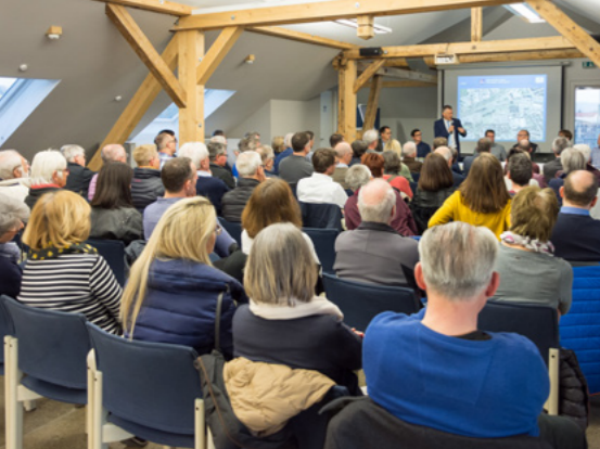
Bürgerbeteiligung beim neuen Wohngebiet „Storchengärten“.