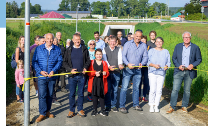
Optimale Radwegeanbindung von Herlazhofen.

Kurze Beine – kurze Wege – gute Betreuung: In unseren Ortschaften wurden Millionen für eine gute Betreuung investiert. In Gebrazhofen sind KiTa und Grundschule zukunftssträchtig unter einem Dach vereint. In Wuchzenhofen und Diepoldshofen wurde die Betreuungssituation mit neuen Angeboten deutlich ausgeweitet, in Reichenhofen die Sanierung des Kindergartens finanziert und die vorbildlichen Betreuungsangebote an der Grundschule unterstützt.