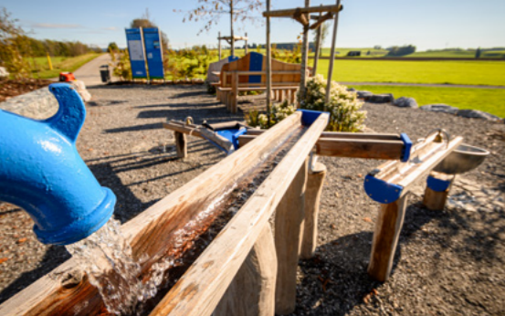
Erlebnispfad mit tollen Spielstationen (ehem. Bahndamm).

Mit neuen Buslinien, weiteren Radwegen, dem Ringzug nach Ravensburg, neuen Carsharing-Angeboten, dem schnellen Ausbau des Nahwärmenetzes und der erneuerbaren Energien sowie der Schaffung von Wasserstoffquartieren setzen wir diesen Weg erfolgreich fort: für unsere Kinder und für unsere Enkel!