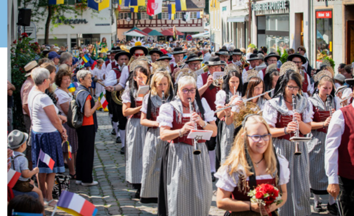
Ein großer Schatz: unsere 14 Musikkapellen bereichern das kulturelle Leben.

Mit den Vergünstigungen einer neuen LeutkirchKarte stärken wir in Zukunft dieses außergewöhnliche Engagement zusätzlich.