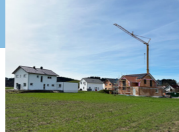
Verwirklicht – der Traum vom Eigenheim in Diepoldshofen.

Auch wenn es gar nicht unsere Aufgabe ist – wir haben das Glasfasernetz in den letzten Jahren in vielen Ortschaften ausgebaut. Endlich ist auch der Zuschussbescheid des Bundes da und wir können richtig loslegen: Wir investieren über 60 Mio. € in die „Autobahn der Zukunft“ – Glasfaser für Stadt und unsere Ortschaften!