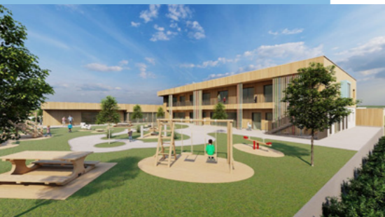
Der Bau des neuen Kindergartens im Ströhlerweg hat schon begonnen.