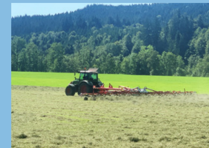
Wunderschöne Allgäulandschaft gepflegt von unseren bäuerlichen Familienbetrieben.