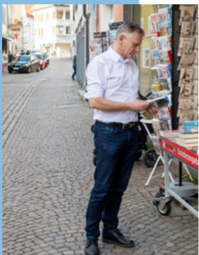
Wir haben tolle Geschäfte und bald auch ein gut begehbares Pflaster.